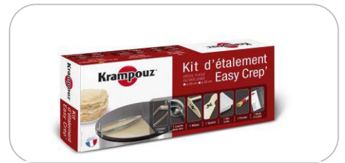
Kit d'étalement / kit spreader