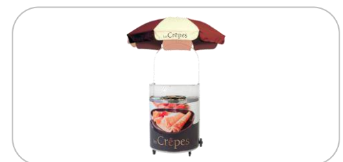
Chariots à crêpes / crepe carts