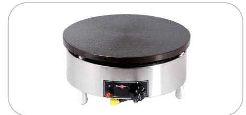
Crêpières gaz / gas crepe makers