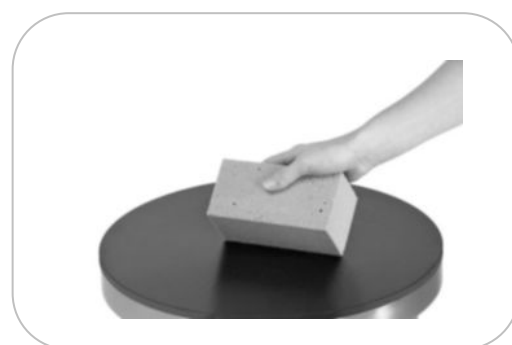
Pierre abrasive Abrasive stone APA1