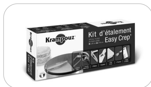
Kit d'étalement Spreader kit AKE84