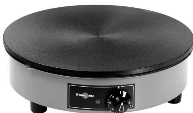
« La Billig »